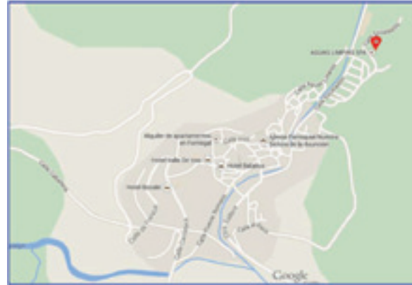
Polideportivo polivalente "El Escaladillo"

La entrada es libre, previa confirmación de asistencia en el correo electrónico: cultura@aytosallent.es o en el teléfono: 974 488 005.